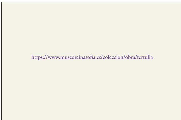
Fig. 31.4 M. a Ángeles Santos, Tertulia , 1929, óleo sobre lienzo, 130 × 193 cm. Museo Nacional Centro de Arte Reina Sofía, Madrid, VEGAP. Esta pintura es, seguramente, una de las representaciones más significativas de aquellas mujeres que tuvieron ambición de leer, discutir y sumergirse en la modernidad por su propio camino. Ángeles Santos fue una de las pintoras más sorprendentes de la vanguardia española, que incorpora en este cuadro, pintado en sus años más jóvenes, la estética del realismo mágico.