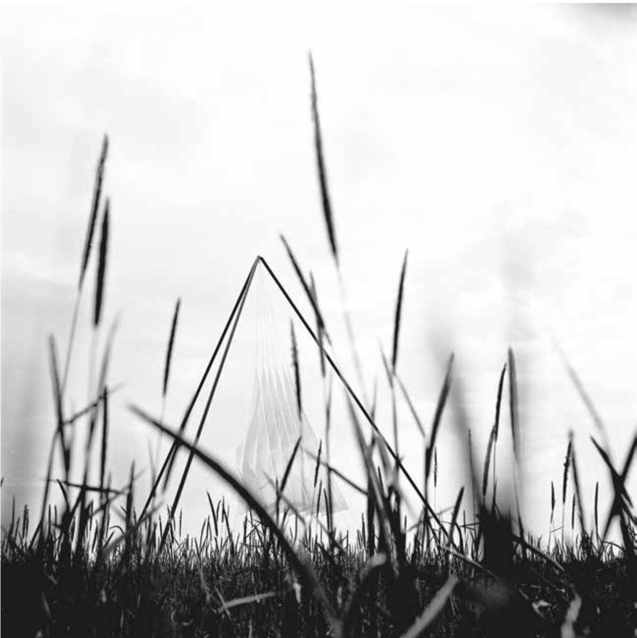
Escultura piramidal al paisatge.