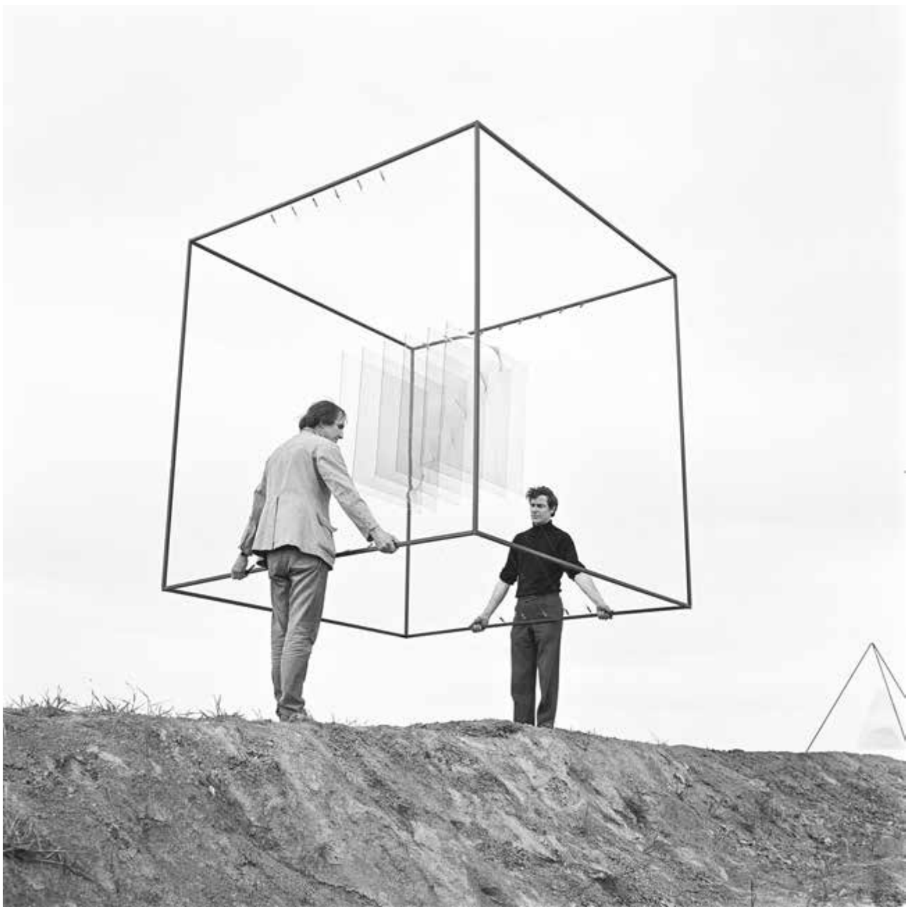
Kowalski i Peary col·locant la peça al paisatge.