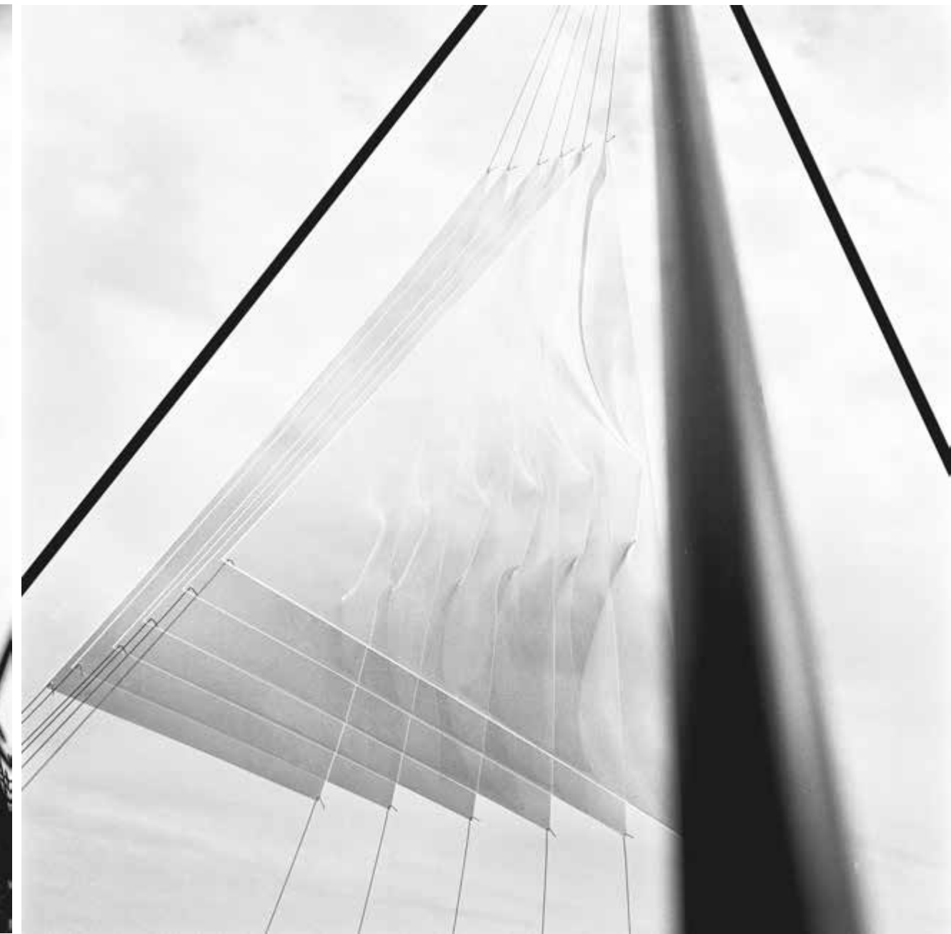
Interior de l'escultura piramidal.