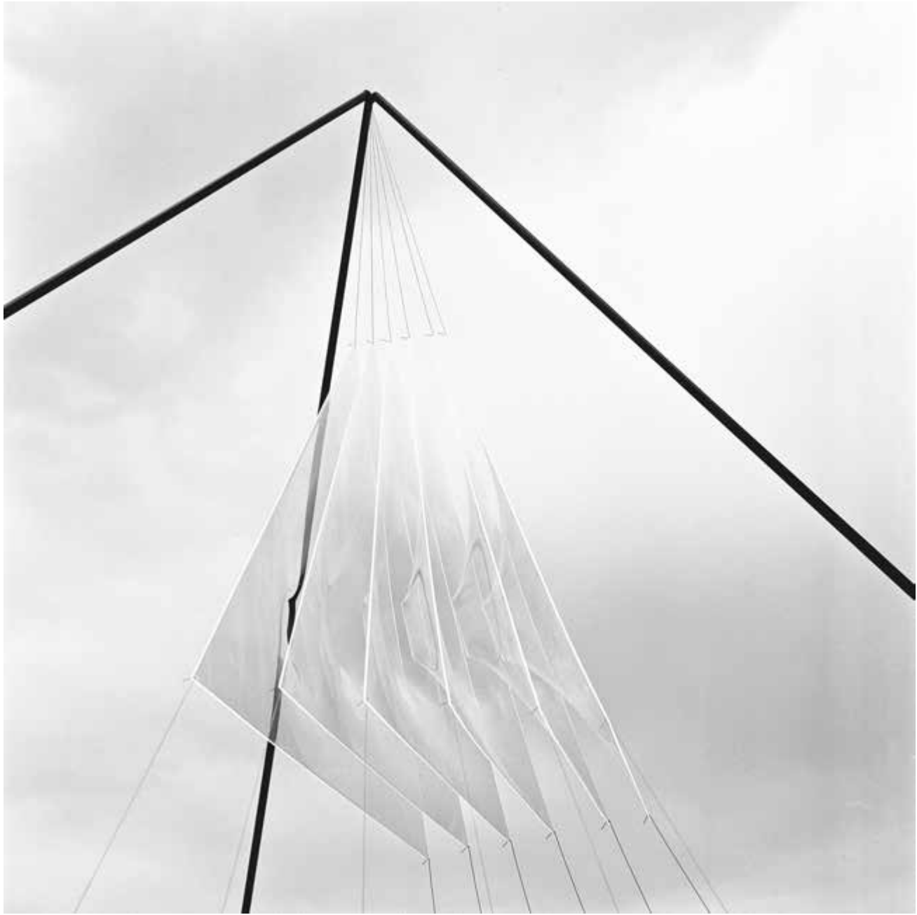
Una altra vista de l'interior de l'escultura piramidal.