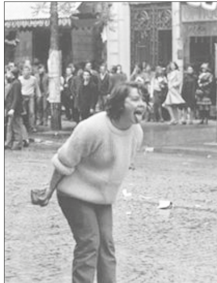
Manifestant al Barri Llatí de París, Maig del 68.

espectable ronyós invitaven tothom a anar amb ells a Beaux Arts (eren estudiants de Belles Arts) a ajudar a fer els cartells que van definir aquell moment històric. Dit això es van aixecar tots i van deixar la sala. Ningú els va seguir excepte el que subscriu. No m'estic posant cap medalla, però va anar així. No tenia res a perdre, també és veritat. Em van acollir molt alegrement i com que tenia l'ofici de dibuixant de publicitat, com es deia aleshores, que havia après del meu pare, ràpidament se'n van adonar que retolava molt bé i això es el que vaig fer mentre vaig córrer per Beaux Arts (on estava matriculat, tot sigui dit, encara que no hi vaig anar mai excepte durant aquells dies). No vaig, però, arribar a dissenyar un cartell complet, llàstima!