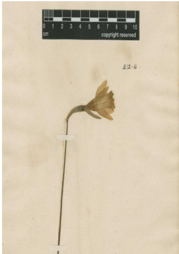
Fig. 1: EPYTIPUS de N. minor L.

Epitypus (hic designatus): LINN 412.4 (fig. 1).