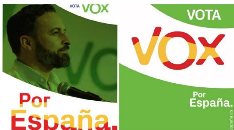
Figura 6. Cartel oficial de VOX

El propio nombre del partido es en sí mismo un acierto desde el punto de vista de la creación de marca y la identidad corporativa. Es sencillo, directo, fácil de recordar y muy alegórico. No es unas siglas, ni una palabra en castellano sino un término procedente del latín que se traduce literalmente por voz. De ahí la importancia de la selección de la imagen, su líder frente al micrófono que va a permitir que su mensaje se difunda y llegue a todos los rincones. La elección y combinación de los colores no es casual. Por una parte, el cartel se divide de forma simétrica en dos banderas que actúan cual positivo-negativo y juegan a ser una bandera que ondea al aire con los colores corporativos de Vox que aquí recuerdan a la bandera Andaluza primer territorio, electoralmente hablando, ganado. El espacio ocupado por cada una de las franjas coincide en grosor con el doble ancho de la banda amarilla central de la bandera patria y además al darle efecto de movimiento simula ondear al viento.