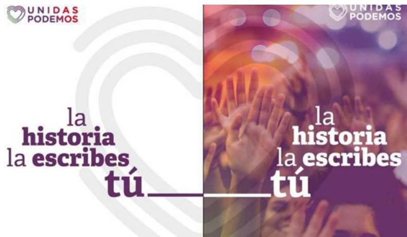
Figura 4. Cartel oficial de Unidas Podemos

Es significativo también, que la imagen elegida esté desenfocada. Esta decisión puede estar relacionada con el intento de evitar polémicas aludido antes, pero entendemos que responde mejor a la idea de anonimizar a la gente y las personas, que no el pueblo, como el conjunto de la ciudadanía que es la verdadera protagonista de las políticas del partido. Esto se ve reforzado por la presencia del eslogan, “la historia la escribes tú”, que definitivamente borra cualquier veleidad de protagonismo que se les pudiera atribuir a los líderes del partido.