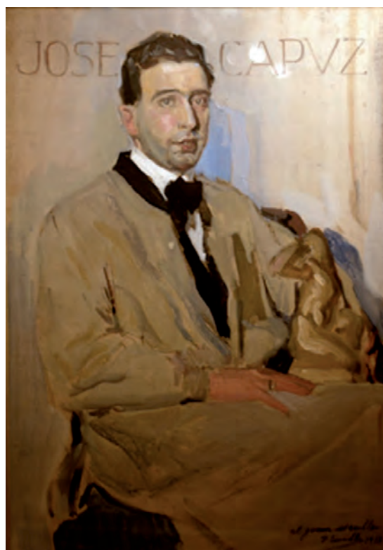
Fig. 1.- Joaquín Sorolla, Retrato de José Capuz Mamano , 1918. Colección particular.

éxito en esa época, José Capuz se instaló a Madrid después de su formación 5 en las escuelas de San Carlos y San Fernando y el tradicional periplo por los centros de arte internacionales de la época (Roma 6 y París 7 y distintas ciudades italianas, como Florencia y Nápoles). Al residir