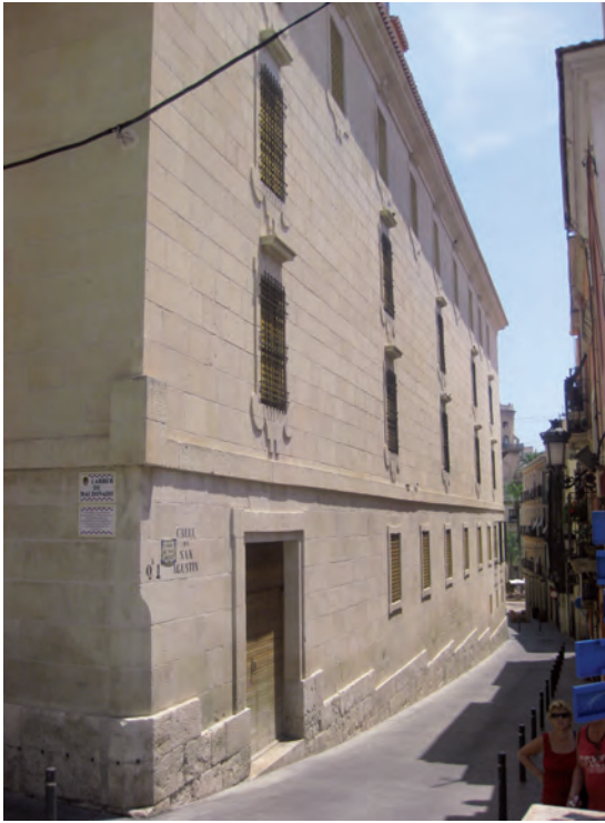
Fig. 2.- Antiguo colegio jesuita de Alicante. Vista general.