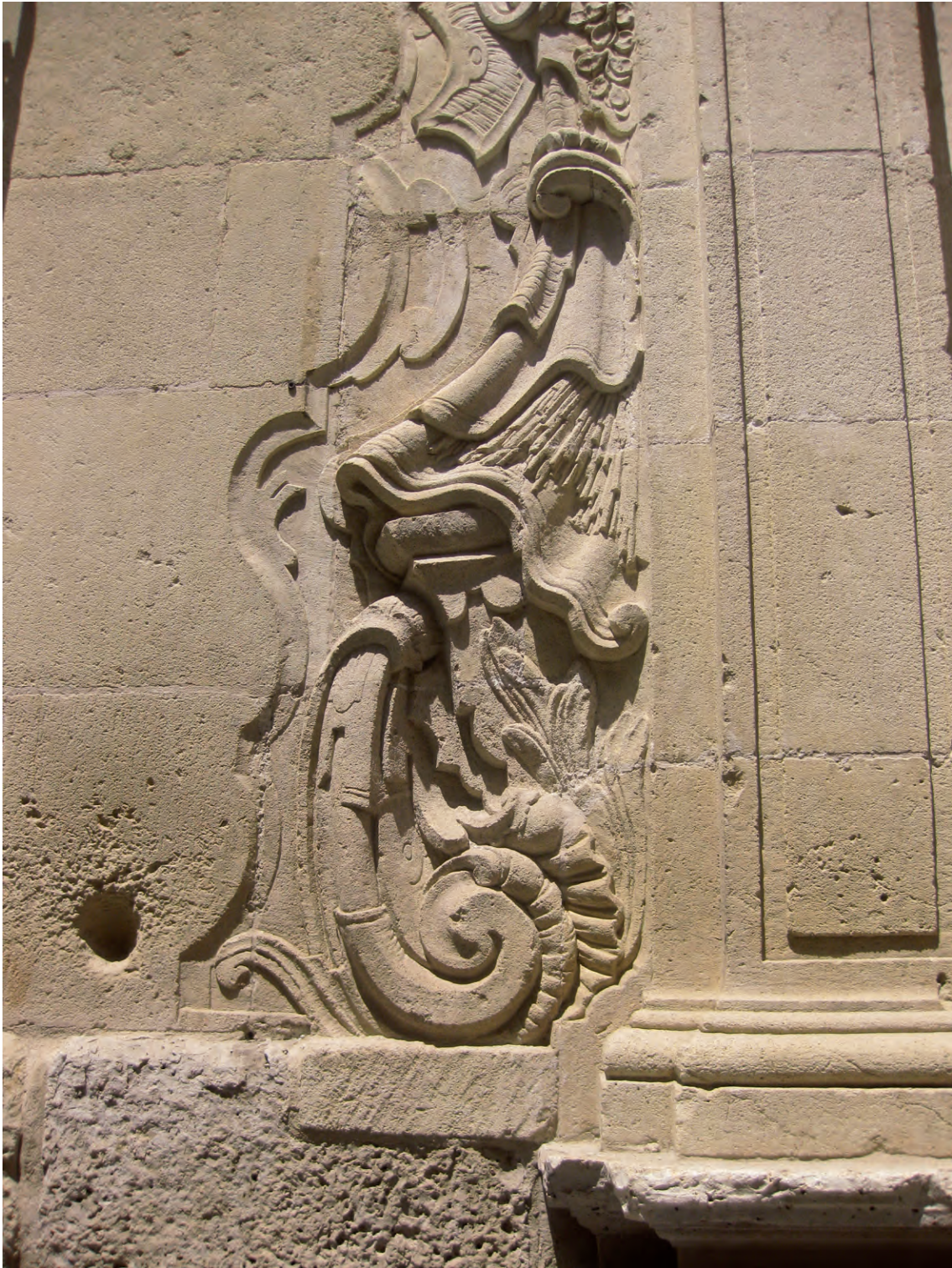
Fig.5.- Antiguo colegio jesuita de Alicante. Detalle de la portada