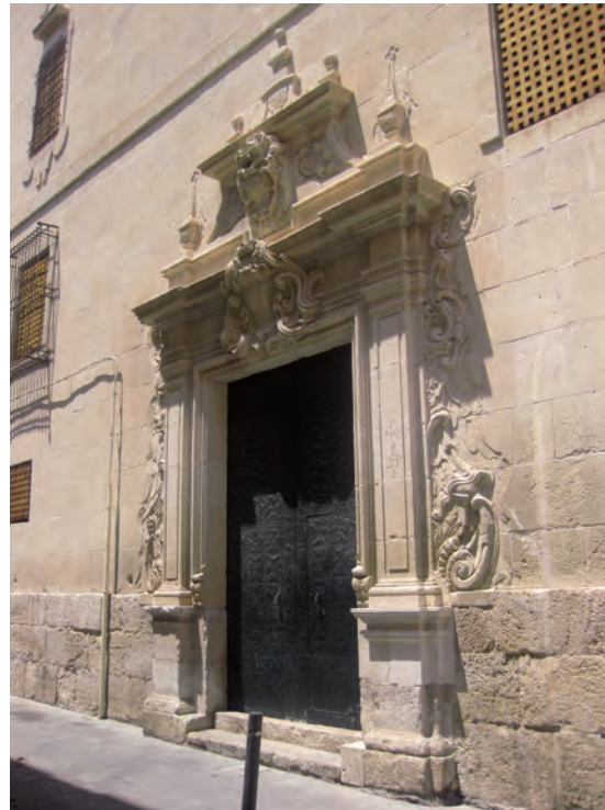
Fig. 4.- Antiguo colegio jesuita de Alicante. Portada.