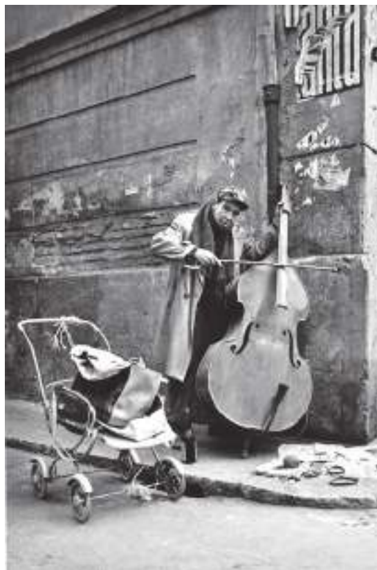
El hombre del violón (Rastro de Valencia) 1968-1970