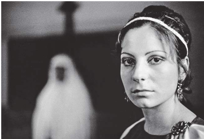
Símbolismo I (Joven muchacha en el aula) 1968-1970