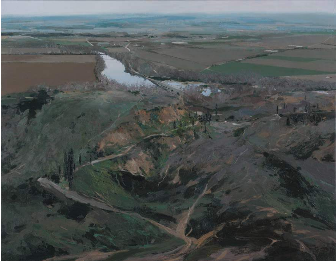
Duero Óleo sobre lienzo 114 x 146 cm. 2016