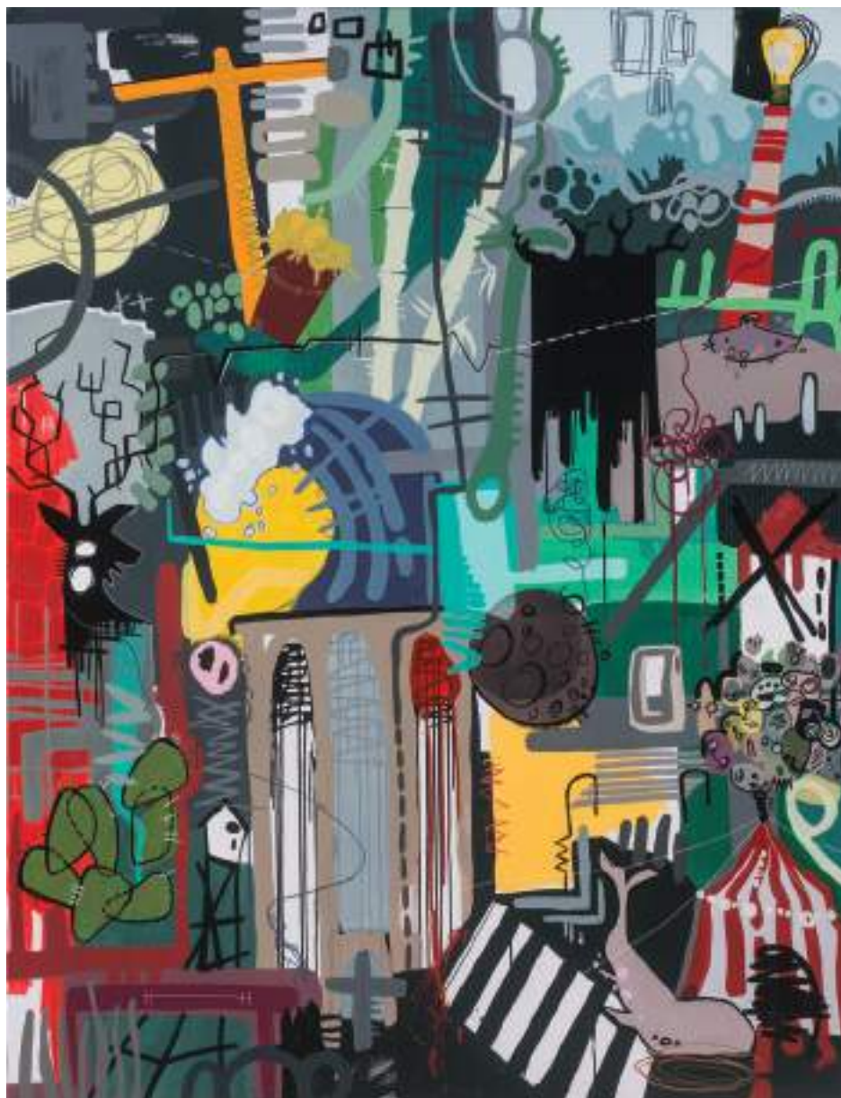
A ningún lugar cualquiera Mixta sobre tela 195 x 150 cm. 2015