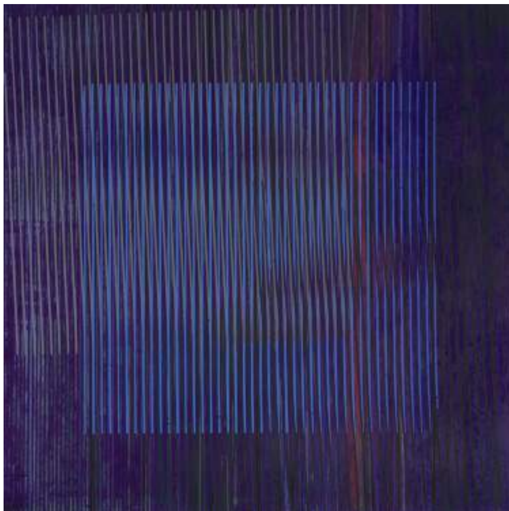
S.T. Acrílico sobre tela 146 x 146 cm. 2015