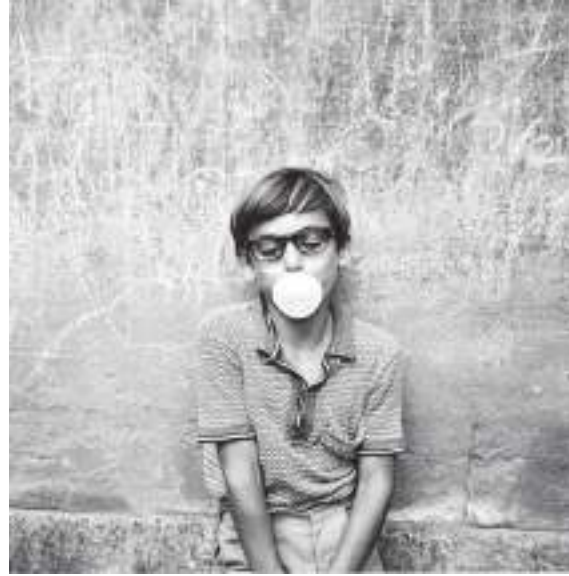
Niño y chicle (El niño del globo) 1968-1970