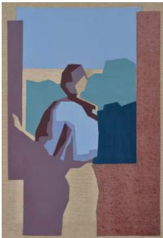
En la ventana Óleo sobre lienzo / Collage 50 x 35 cm. 2011