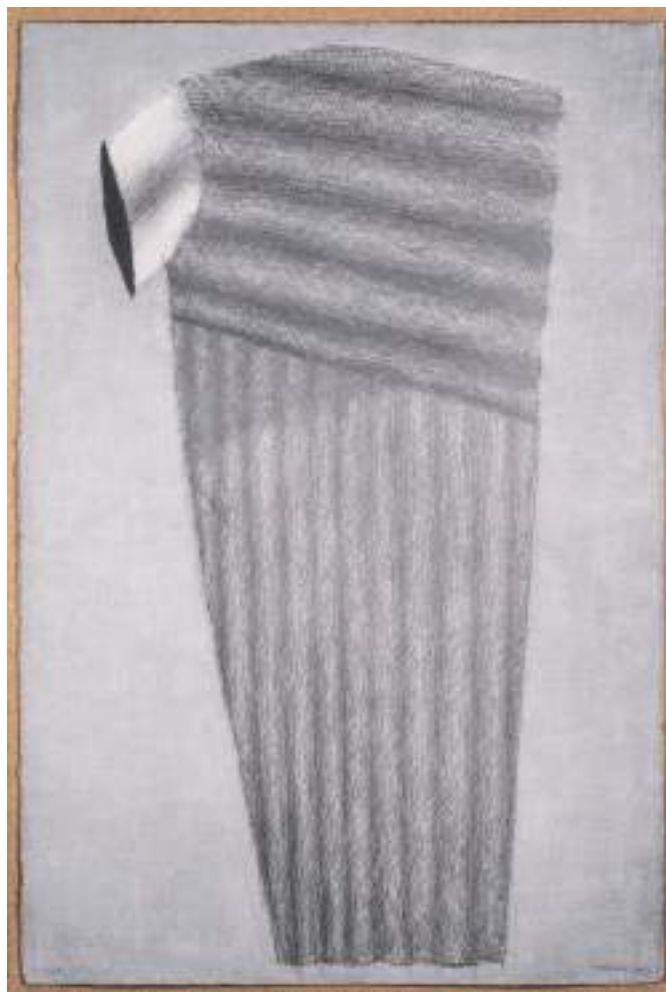
R-1075 Dibujo a grafito sobre papel 154 x 103,5 cm. 2007