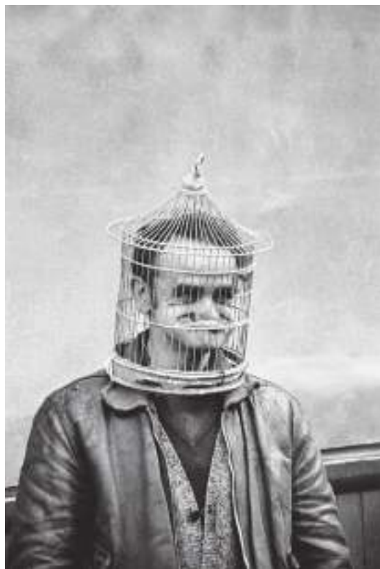
Mudo y jaula (Rastro de Valencia) 1968-1970