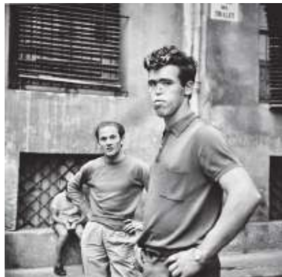
Principio y fin (Plaza de San Esteban) 1968-1970