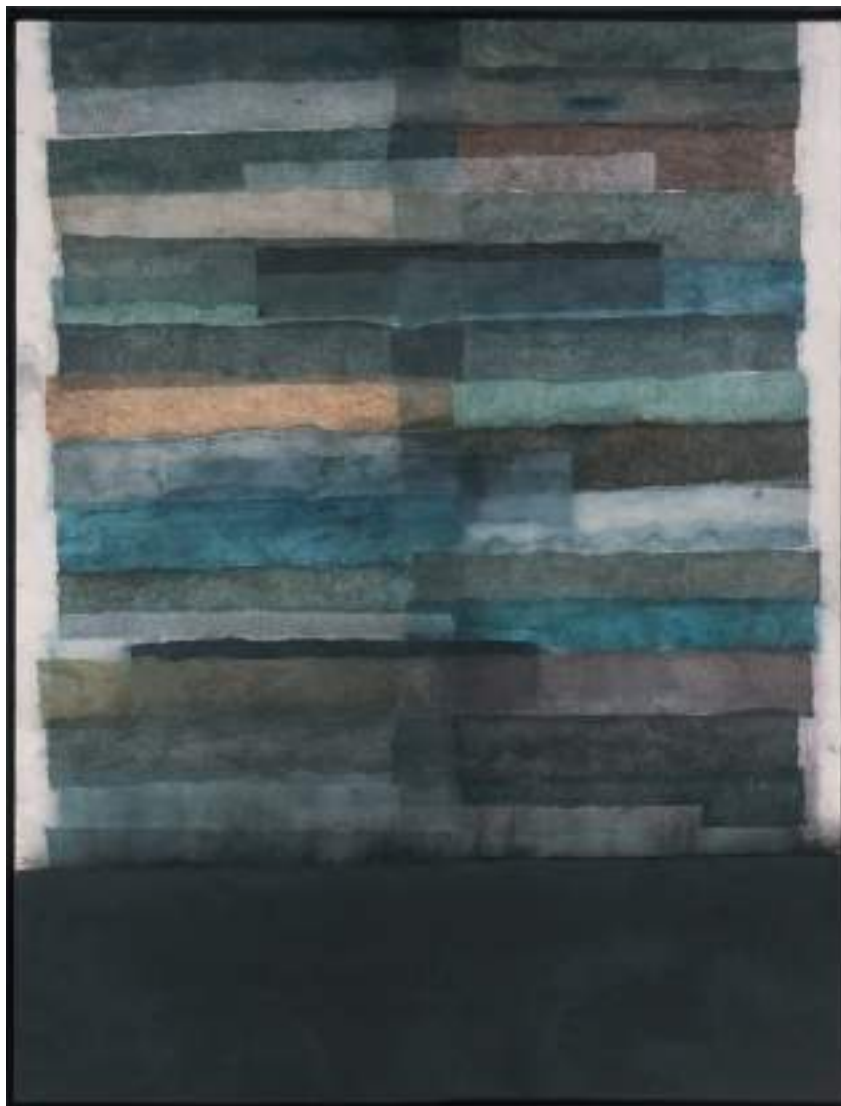
Levitas Técnica mixta sobre tabla 195 x 150 cm. 2016