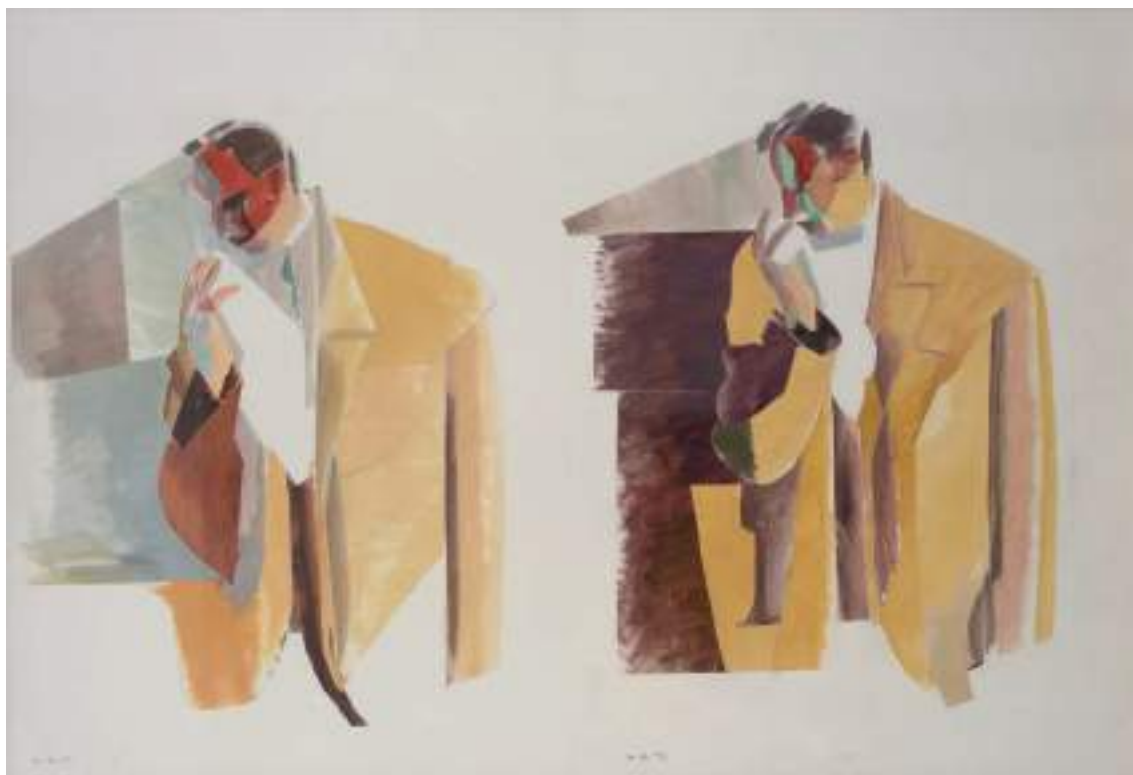
S.T. Collage sobre papel 76 x 100 cm. 1993