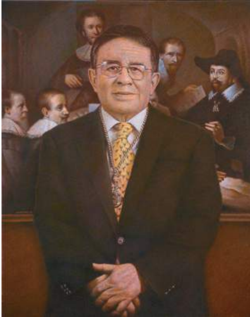
Retrato de Manuel Muñoz Ibáñez Presidente de la Real Academia de Bellas Artes de San Carlos Óleo sobre lienzo 87,5 x 69 cm. 2016 (Firmado y fechado por el autor en el lado izquierdo "Armengol-16")