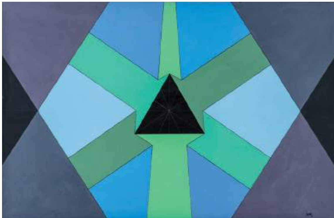
Triángulo equilátero inscrito Acrílico sobre madera 80 x 123 cm. 1970 (restaurado en 2012) [Firmado por el autor en el ángulo inferior derecho]