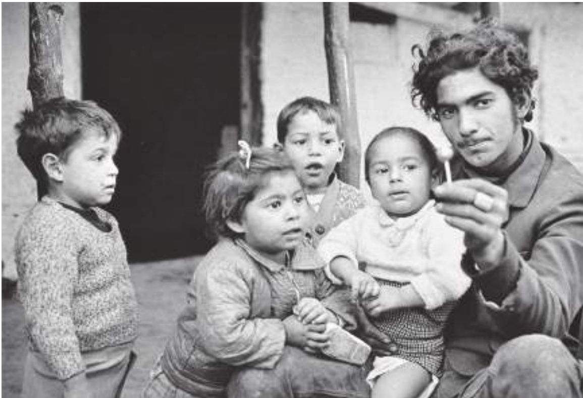
Ese chupachup me lo como yo (Gitanos) 1968-1970