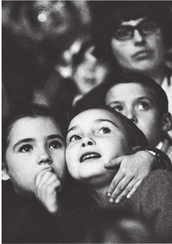
Será posible (Circo) 1968-1970