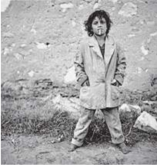
Niño gitano (A las afueras de Valencia) 1968-1970