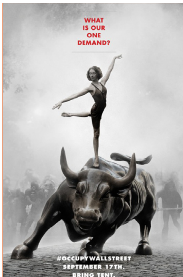
Figura 4. #OccupyWallStreet. Fuente: Adbusters. Julio 2011.

Esto evoca algo que ya había ocurrido en New York, en 2011, cuando Adbusters difundió un cartel al que se atribuye el inicio de Occupy Wall Street . En él se aprecia una bailarina de ballet, sobre la escultura del toro que simboliza a Wall Street (ver figura 4). En la parte superior de la imagen hay una pregunta: “ What is our one demand? ” En la parte inferior, hay una invitación: “ #OccupyWallStreet September 17th. Bring tent ” (Beeston, 2011; Bierut, 2012; Yardley, 2011).