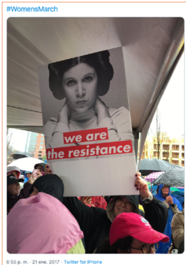
Figura 1. #WomensMarch. Fuente: @IBexWeBex (21 enero 2019)

También en 2017 se estrenó la serie española La Casa de Papel , dirigida por Álex Piña. La historia se transmitió inicialmente por Antena 3 en España y, posteriormente, por Netflix. En ella se aborda un atraco mayúsculo, liderado por El Profesor, para poner en jaque a los poderosos. La serie ha sido apropiada también como símbolo de resistencia. Los disfraces y máscaras que utilizan los personajes han sido empleados en las protestas en Chile, México (ver figura 2), Irak y otros países (Miranda, 2019). Además, en la serie se canta “Bella Ciao”, una canción italiana que fue apropiada como símbolo de protesta anti-fascista en Europa desde mediados del siglo XX. Esta canción, que ya había sido empleada en protestas recientes como la Nuit Debout en Francia, ha sido retomada en 2019 a partir de la popularidad de la serie. Así, algunos manifestantes colombianos cantaron “Duque ciao, Duque ciao, Duque ciao” para pedir la renuncia del presidente Iván Duque, mientras que en Irak se ha escuchado también en las protestas contra la corrupción (Carrión, 2019; La República, 2019).