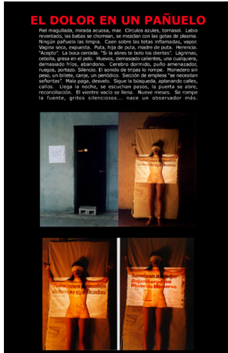
Fig. 2. Dolor en un pañuelo (Regina José Galindo, 1999). © Regina José Galindo (cortesía de la artista).