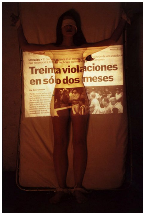
Fig. 1. Dolor en un pañuelo (Regina José Galindo, 1999). © Regina José Galindo (cortesía de la artista).

Los procesos de igualdad, diferencia, libertad y resignificación que han caracterizado la historia del feminismo se ven claramente reflejados en las obras que hemos mostrado, así como en las respuestas que éstas han generado. Del poder discursivo y del carácter expresivo de la performance como arte da buena cuenta, sin duda, la excelente aceptación que la práctica tuvo en el seno del arte para muchas mujeres, tal y como se desprende en estas páginas.