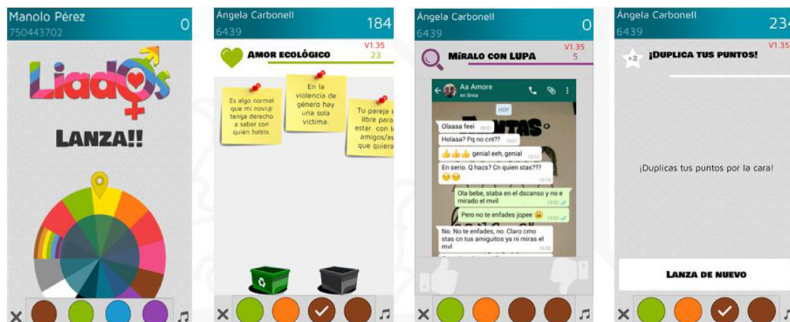
Figura 1. Imágenes de funcionamiento de la app Liad@s a través de varias pruebas.

En el grupo experimental, al finalizar la intervención se administran de nuevo los cuestionarios para verificar la eficacia de la misma.