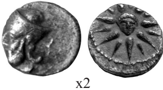
Fig. 3. Divisor incierto (0,38 g).