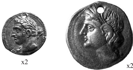
Fig. 7. Cuarto de shekel (1,70 g) y shekel hispano-cartagineses (7,14 g) perforados (ACIP 555 y 565). 25

buscaba facilidad y comodidad pues, dado su reducido tamaño, dichas piezas eran más susceptibles de perderse que otras, de ahí que se taladraran de forma descuidada. Incluso hay paralelismos con moneda bajoimperial y medieval castellana (fig. 8).