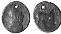
Fig. 6. ¿Medio shekel hispano-cartaginés forrado? (16-17 mm, 3.01 g, 2 H).

El peso de esta curiosa moneda suntuaria, si bien se puede ajustar a un quinto o sexto hispano-cartaginés de bronce (ACIP 610-611), en cualquier caso inédito, en realidad parece tratarse de un medio shekel forrado que no ha conservado su baño de plata. De acuerdo con lo expresado, la iconografía sí coincide con ciertos tipos (ACIP 615 o 617), descritos en anverso con cabeza viril desnuda a izquierda y en reverso con caballo parado sin palmera. La perfecta perforación