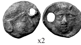
Fig. 2. Divisor incierto (0,55 g).