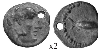
Fig. 4. Tartemorion de Gadir (0,23 g).

tas respecto a los demás divisores, considerados hoy día como ‘inciertos’ en materia de circulación menuda. El nuevo par de hallazgos se componen, por un lado, de un hemióbolo de Gadir (fig. 1) y, por otro, de un óbolo incierto (fig. 2). Para la primera de ellas, con Melkart a la izquierda en su anverso y con un atún a la derecha en su reverso, se viene estimando una datación de ca. 237-206 a.C. 7 Anteriormente ya se había seguido este marco cronológico, pues para el tartemorion de Gadir (fig. 4) se propone la misma fecha; de esta manera, el divisor atribuido tradicionalmente 8 a Malaka (fig. 3) se ha podido datar en esta franja, pues ambos hallazgos debieron formar parte de una “taleguilla” o de un dinero para el menudeo. 9