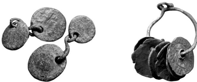
Fig. 8. Monedas bajo imperiales (siglo IV d.C.) y medievales (¿cornados de Alfonso XI?) engarzadas en época.

No es que sean tampoco las de plata las preferidas para horadarse, sino que es su tipología la batida en mayor cantidad frente a la de bronce en ese espacio y tiempo, por lo que más bien es un hecho estadístico de susceptibilidad o probabilidad. Los divisores que provienen de hallazgos documentados como aislados (véanse los presentes) aparecen casi todos perforados, vestigio concluyente para argumentar que dichas piezas menudas constituían, entre soldados durante el período de preguerra, el grueso monetar cotidiano puesto en circulación por los cartagineses.