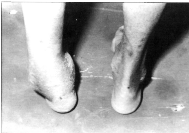
Figura 2. Aspecto clínico del paciente el 13/9/85 apreciándose tumefacción del tobillo izquierdo y engrosamiento global del mismo y una deformidad en varo.

presentando tumefacción del tobillo izquierdo con engrosamiento global del mismo y deformidad en varo (Fig. 2). No había signos inflamatorios ni dolor a la palpación. La movilidad del tobillo estaba ligeramente limitada en cuanto a la flexo-extensión y era indolora. No se percibían pulsos periféricos a nivel de la tibia posterior y de la pedia; la sensibilidad superficial estaba conservada, no había alteraciones motoras y el reflejo aquileo estaba abolido. El doppler mostraba normalidad de ambas arterias femorales y curvas tipo III en tibia posterior y pedia derechas, que indican la existencia de flujo pero muy disminuido. A nivel del tobillo izquierdo; la tibia posterior y pedia se perciben pero no se registran. El estudio radiográfico mostró en la proyección anteroposterior la desintegración del maleólo medial y una fractura de la superficie articular astragalina (Fig. 3). El scanning con Tc99 mostraba una gran captación del isótopo a nivel de dicho tobillo. Se le prescribe una ortesis de descarga. En la revisión realizada a los tres meses persiste la deformidad en varo con la movilidad del tobillo conservada casi totalmente e indolora. La exploración radiográfica muestra una necrosis del cuerpo del astrágalo que se encuentra reducido a un pequeño casquete, así como la fractura de la superficie astragalina (Fig. 4). Superada la fase aguda se le prescribe calzado ortopédico estabilizador de la deformidad del tobillo.