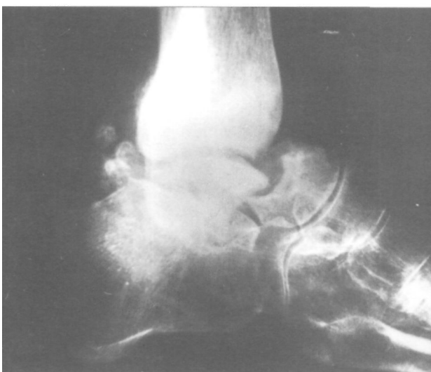
Figura 4. Radiografías de perfil (enero de 1986). Necrosis del cuerpo del astrágalo.