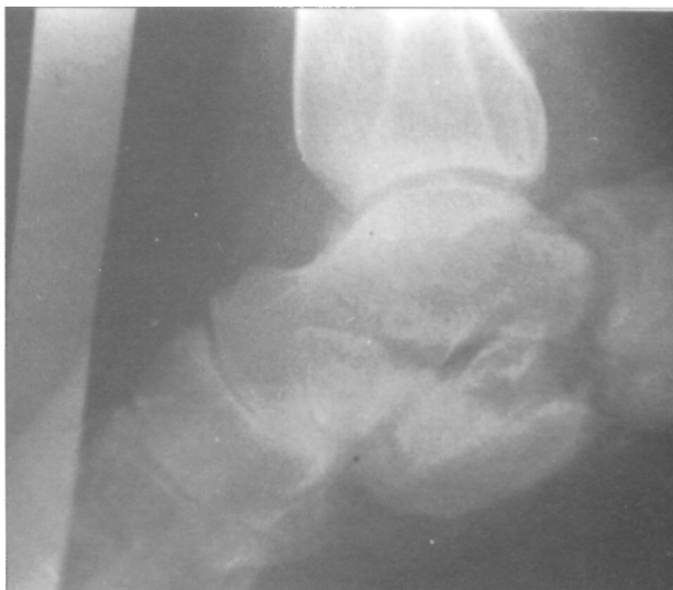
Figura 5. Radiografía lateral del calcáneo en abril de 1990. Fractura conminuta e intraarticular del calcáneo derecho.

inicio de los síntomas. Posteriormente, cuatro años y medio más tarde, presenta una fractura espontánea del calcáneo contralateral y tres meses después una fractura del platillo tibial interno de la rodilla izquierda.