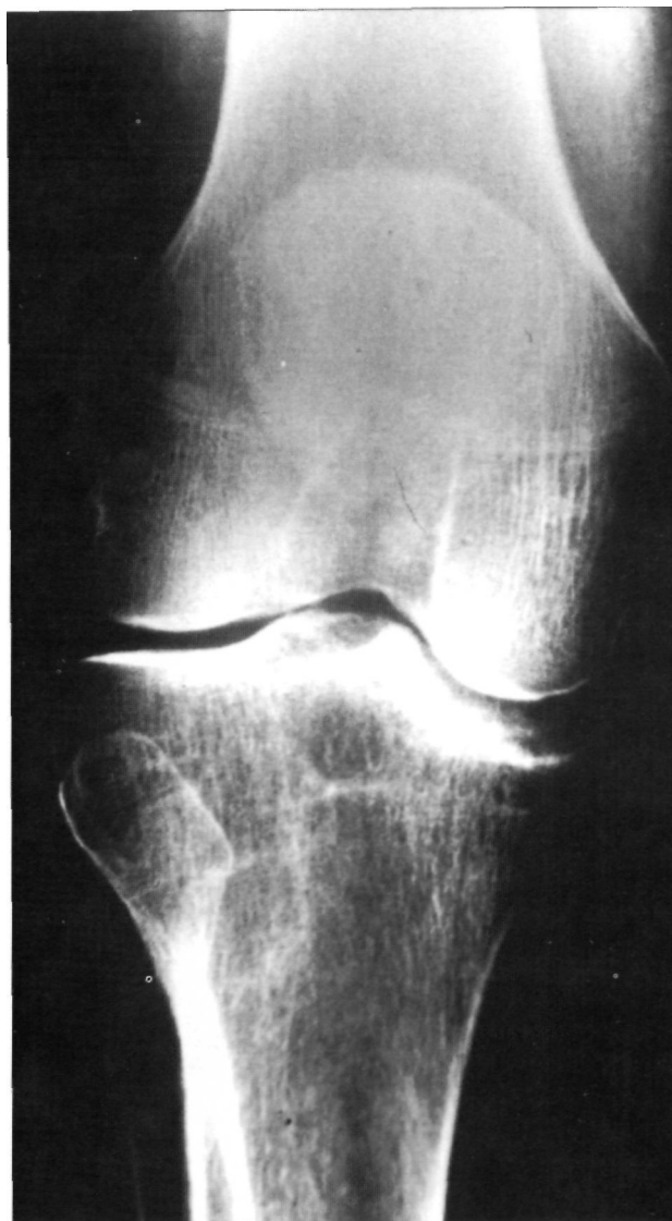
Figura 6. Radiografía anteroposterior de rodilla izquierda. (Noviembre de 1990). Hundimiento de la vertiente medial del patillo tibial interno.

El tratamiento consiste en la inmovilización y descarga mediante ortesis durante la fase aguda, lo cual mejora el resultado y marcha posterior. Dado su alto porcentaje de afectación bilateral Cloisy y Thompson (2) aconsejan en los enfermos de "alto riesgo", como es el caso que nosotros presentamos, una protección profiláctica de la extremidad no afecta durante el tiempo que dura la descarga en la extremidad afecta. Si el enfermo es reacio a aceptar este tratamiento se aconseja una vigilancia extrema de la extremidad para detectar cualquier alteración clínica y/o radiológica que haga necesaria la inmovilización y descarga de la misma.