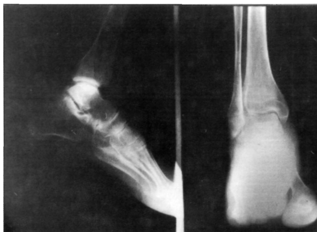
Figura 1. Radiografía anteroposterior y perfil del paciente tras sufrir un esguince de tobillo (11/8/85) en la que sólo se aprecia una osteoporosis moderada.

En Julio de 1985 sufre una caída de moto con contusiones leves. A los tres días presenta molestias discretas y tumefacción en tobillo izquierdo. Ante la persistencia de la tumefacción y pese a las escasas molestias se le practica estudio radiográfico en el que no se objetiva ninguna alteración (Fig. 1), siendo etiquetado de esguince de tobillo. Se le prescribe vendaje elástico y reposo relativo, aunque sigue caminando ante la ausencia de molestias. Dos meses después del traumatismo inicial acude nuevamente a revisión