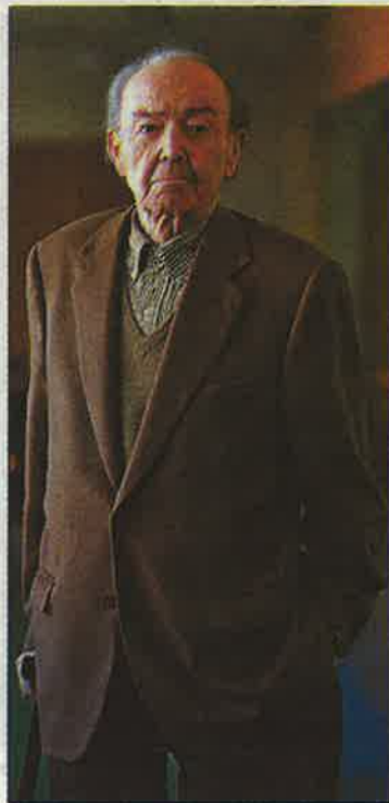
José Vidal-Beneyto.