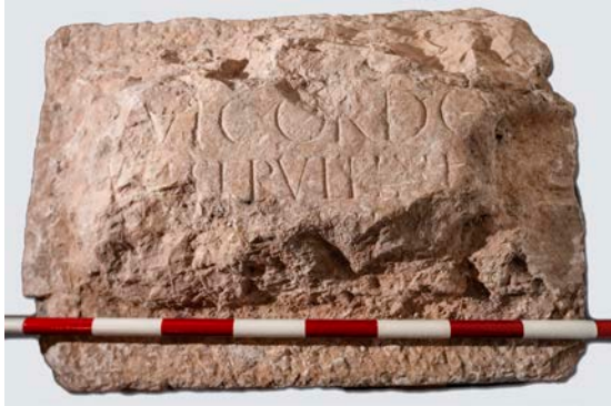
Fig. 3. Inscrició provinent de calcària del solar de l'Antiga Casa del Rei.