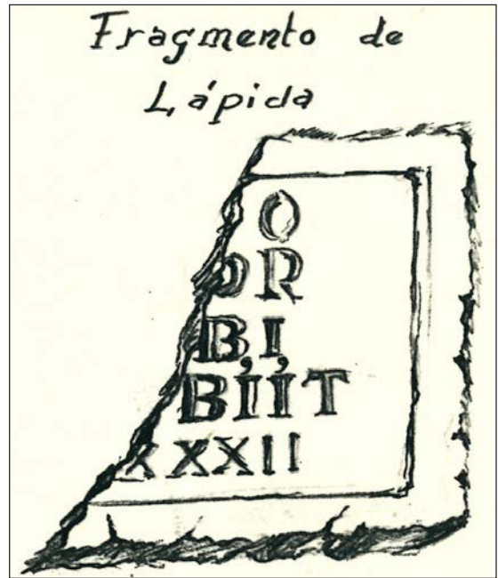
Fig. 2. Detall del dibuix de la làpida al croquis de R. Fluixá.

ta d'un carreu paral·lelepípede de pedra calcària clara amb unes dimensions de 60 x 83,5 x 33 cm (figs. 3-4). Presenta un important rebaixament en una franja perimetral de la cara frontal –a manera d'un groller encoixinat– d'11,5 cm de profunditat i fins a 11 cm d'amplària. Aquest afecta la major part del camp epigràfic, que d'aquesta manera només es conserva en una reduïda porció de la zona central de 19 x 50 cm. Del text es veu part