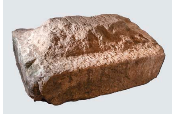
Fig. 4. Vista lateral de la inscripció on s'aprecia el rebaixament lateral.

de tres línies, de les quals les dues primeres conserven tota la seua alçària i la tercera només l'extrem superior d'algunes lletres. Amb seguretat devia haver-hi, almenys, una línia per damunt de la primera conservada i una altra per davall de la darrera, de manera que el text constava d'un mínim de 5 línies. L'altura de les lletres és de 7,5 cm en la primera línia i de 5,5 cm en la segona. En la primera es veu un punt triangular amb vèrtex cap avall. La lletra és molt acurada i presenta reforços; com a trets particulars podem dir que la O és rodona i la P és oberta. El text, restituït parcialment, és com segueix: