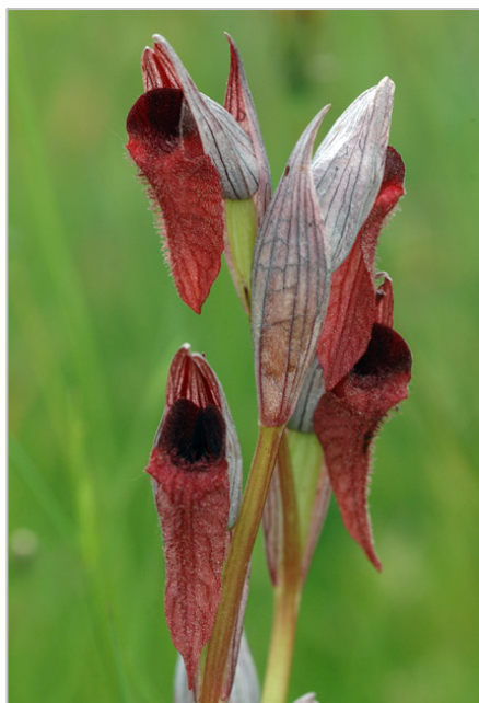
Fig. 3: Serapias vomeracea procedente de Cereceda (M).

Volviendo al ámbito geográfico que nos ocupa, todo indica que las plantas de Javalambre citadas por RIVAS GODAY & BORJA (op. cit.) corresponden también a S. vomeracea y muy posiblemente también las de Tramacastilla (pliego de Almagro), ya que desde Griegos a esta localidad hay menos de 12 km en línea recta y los términos municipales son colindantes. En todo caso este pliego, como ya hemos comentado, no es del todo claro y demanda confirmación en el campo.