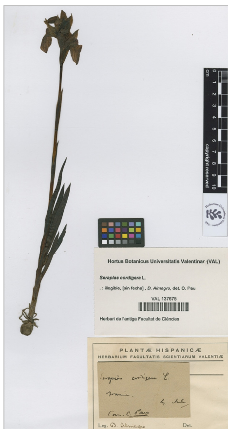
Fig. 1: Pliego de VAL con muestra de S. vomeracea sin localidad clara, atribuido a Tramacastilla (Teruel).

de S. lingua ni de S. parviflora (las otras dos posibles candidatas lógicas). Las flores tienen el epiquilo relativamente ancho lo que nos lleva a S. cordigera (fig. 1), aunque es más corto y de menor tamaño de lo habitual para un ejemplar bien desarrollado de la especie, como es el caso (casi 30 cm de altura). No hemos llegado a ver el original del pliego, solamente una imagen escaneada, y su estudio detallado resulta problemático ya que solamente hay un ejemplar con 3 flores abiertas y la determinación fiable podría ocasionar la pérdida de parte o la totalidad del material.