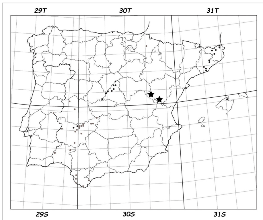
Fig. 4: Datos sobre Serapias vomeracea en España. Los puntos negros corresponden a localidades comprobadas, los grises a citas no comprobadas y las estrellas a las nuevas localidades aquí comentadas.

(Recibido el 28-IV-2014. Aceptado el 10-V-2014)