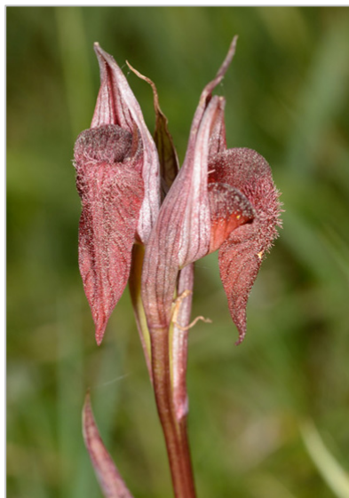
Fig. 3b: Serapias vomeracea procedente de Griegos (Te).

ca, donde fue descubierta en la zona de L'Albufera (ALOMAR & VICENS, 2010).