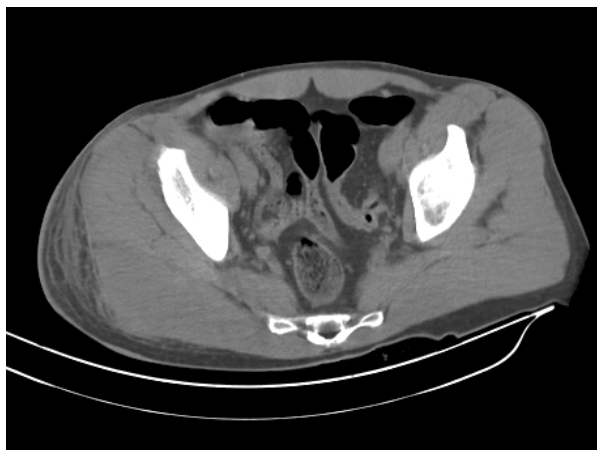
Figura 4. Imagen axial TC donde se aprecia la asimetría en el espesor del músculo glúteo mayor derecho respecto al contralateral.

músculo glúteo mayor, sin evidenciarse colecciones (Fig. 4). La analítica ordinaria mostraba leucocitos marcada y alteración de la hemostasia. El paciente ingresó en la Unidad de Cuidados Intensivos por fracaso renal agudo secundario a posible celulitis glútea. A las 12 horas de ingreso se procedió a desbridamiento quirúrgico del compartimento glúteo al aparecer flictenas hemorrágicas y persistir el estado anúrico del paciente, con sospecha, entonces, de fascitis necrotizante. Se pautó antibioterapia empírica con ceftriaxona, gentamicina, levofloxacino y vancomicina. Se obtuvo confirmación microbiológica de Streptococcus Pyogenes (grupo A). El paciente precisó lavados periódicos durante su estancia en la unidad de cuidados intensivos (15 días), con normalización progresiva de las constantes vitales y de las funciones sistémicas. El paciente evolucionó satisfactoriamente y fue dado de alta a los 20 días del ingreso.