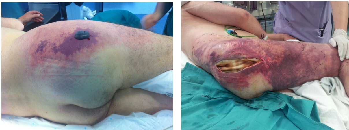
Figura 3. Imagen preparatoria (izquierda) y postoperatoria (derecha) del área de fascitis necrotizante. Obsérvese cómo el rash desborda ampliamente el área de la herida quirúrgica. Entre ambas fotografías sólo habían transcurrido 24 horas.

Varón de 38 años de edad que acudió a Urgencias por dolor intenso en miembros inferiores que le impedía la deambulación, con debilidad generalizada. Como único antecedente relevante destacó la existencia de un proceso infeccioso de vías respiratorias altas por el que consultó en su Centro de Salud, administrándosele hacia 2 días metamizol intramuscular glúteo. El paciente había empeorado clínicamente en ese período de tiempo, con fiebre mantenida, disminución de la diuresis y deposiciones diarreas, sin dolor abdominal asociado. A la exploración sólo destacaba la presencia de tumefacción en el glúteo derecho, en el lugar de la punción, con imposibilidad para la bipedestación, sin otros hallazgos. Se solicitó un estudio ecográfico y TC en urgencias que mostró sólo leve engrosamiento del