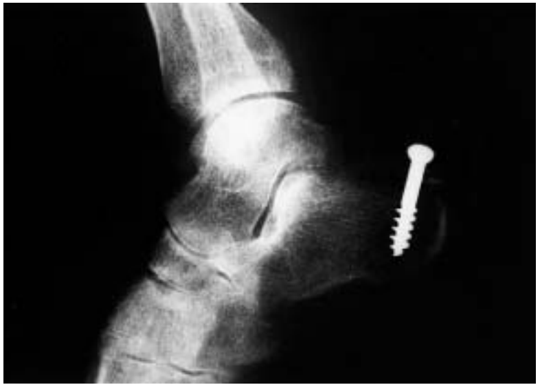
Figura 2. Control radiográfico del caso 1 realizado a los 6 meses del tratamiento de la lesión.