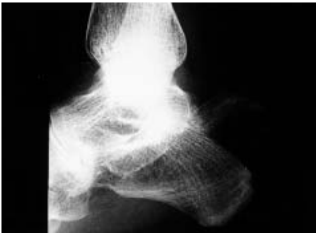
Figura 3. Exploración radiográfica del tobillo izquierdo del caso 2 de la serie (proyección lateral) que muestra la fractura del calcáneo.