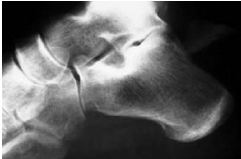
Figura 8. Estudio radiográfico en proyección lateral del tobillo izquierdo del caso 5 de la serie que pone en evidencia el desplazamiento marcado de la fractura.

Se han descrito 3 diferentes mecanismos básicos de producción de la lesión: