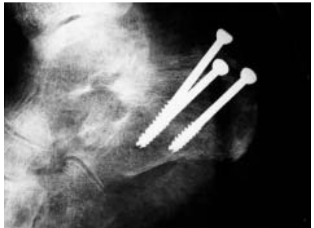
Figura 4. Estudio radiográfico postoperatorio del caso 2.

miento fue quirúrgico y consistió en una reducción abierta de la fractura y osteosíntesis de la misma mediante un tornillo de esponjosa de 6,5 mm de diámetro. Se aplicó asimismo un yeso en equino durante 3 semanas, seguido a continuación de un vendaje escayolado neutro durante 4 semanas más. En la revisión efectuada a los 6 meses de evolución, la paciente refería encontrarse sin dolor y con una movilidad del tobillo enteramente normal. El control radiográfico realizado en dicha revisión demostraba la correcta consolidación de la fractura (Fig. 2).