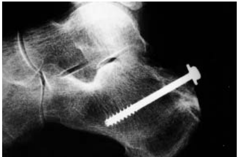
Figura 9. Control radiográfico del tobillo izquierdo del caso 5 obtenida en la fecha de la última revisión en consulta.

- Flexión dorsal violenta del pie en un momento de máxima flexión plantar del mismo, como ocurre típicamente en una caída de altura (1,9).