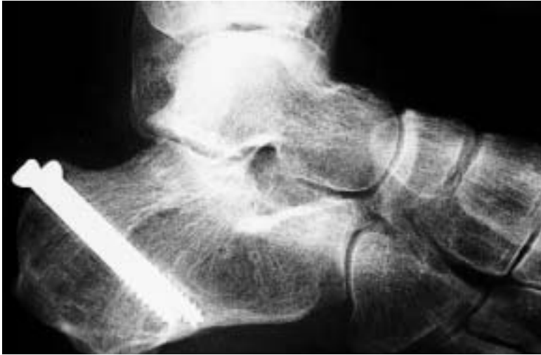
Figura 7. Radiografía del pie derecho del caso 4 de la serie, realizada en la fecha de la última revisión en consulta. La consolidación de la fractura es correcta.

siguió un yeso en posición neutra 4 semanas más. La evolución postoperatoria fue satisfactoria, con una recuperación funcional completa y sin dolor. El control radiográfico final mostraba una correcta consolidación de la fractura (Fig. 7).