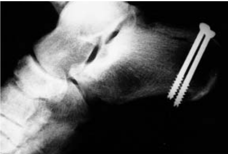
Figura 11. Estudio radiográfico postoperatorio del caso 6. Se aprecia la correcta reducción de la fractura y su osteosíntesis mediante 2 tornillos de 4,5 m. de diámetro.

niño, se produce probablemente por microtraumatismos repetidos en la zona relacionados con actividades deportivas como saltos, que provocan contracciones súbitas del tríceps, condicionando una separación y desplazamiento de la tuberosidad posterior del calcáneo (18).