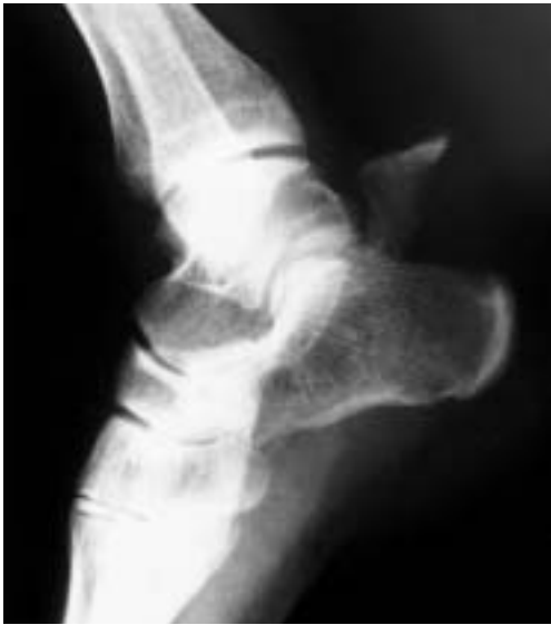
Figura 1. Radiografía en proyección lateral del pie izquierdo del caso 1 en donde se aprecia la fractura en pico de pato del calcáneo.