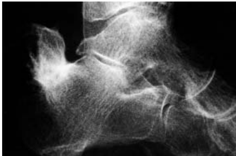
Figura 6. Control radiográfico realizado a los 8 meses de evolución. Se aprecia una consolidación viciosa de la fractura.

traumatismo por torsión del mismo tobillo, presentando dolor intenso e incapacidad para la flexión plantar del tobillo. A la exploración se palpaba una prominencia ósea subcutánea en la cara posterior del talón, muy dolorosa al tacto. El estudio radiográfico ponía de manifiesto una refractura del calcáneo, esta vez con desplazamiento y de características similares a la de los casos anteriores. El tratamiento quirúrgico consistió en la reducción a cielo abierto de la fractura y estabilización con 2 tornillos canulados de 4,5 mm. de diámetro. A esto se asoció una inmovilización con un vendaje escayolado en equino durante 4 semanas, a lo que