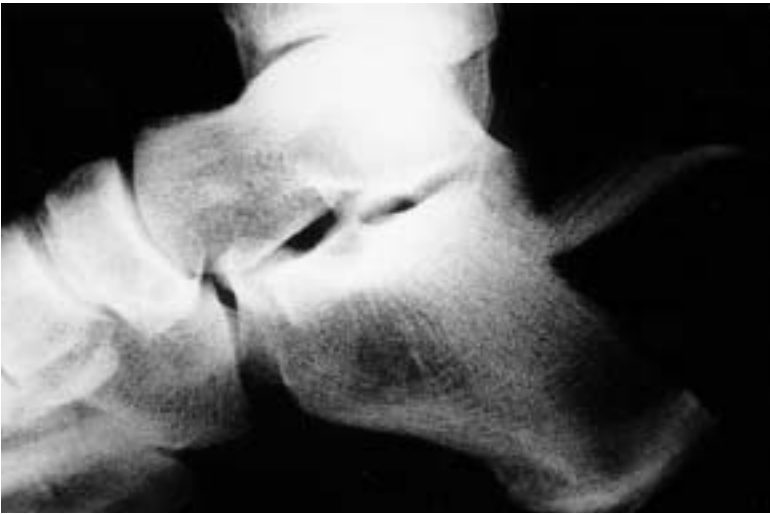
Figura 10. Exploración radiográfica en proyección lateral del tobillo izquierdo del caso 6 que muestra la fractura por avulsión de la tuberosidad posterior del calcáneo.