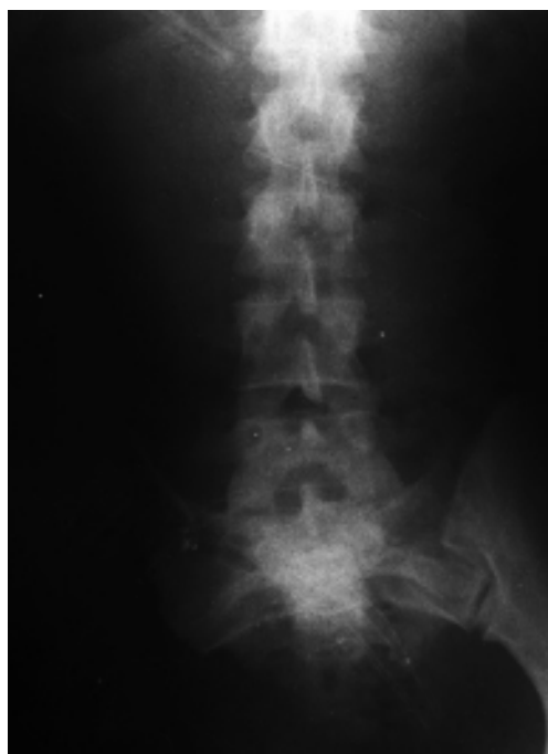
Figura 4. Hemipelvectomía.