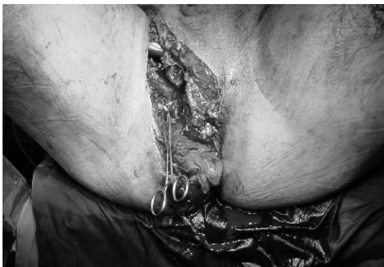
Figura 1. Fractura abierta de pelvis con afectación de partes blandas en periné y lesión sobre sistema genito-urinario.