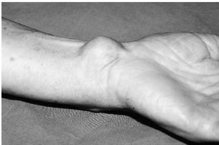
Figura 1. Aspecto clínico del tumor.

Discusión. La localización más frecuente del Schwannoma es en el área cérvico-facial, seguida del tronco, extremidad superior, extremidad inferior y por último en mano y muñeca, donde según las series estudiadas (1,3-5), representan entre el 0,2 y el 16 % de todos los Schwannomas. Según nuestra experiencia clínica, consideramos este tipo de tumor como infrecuente y coincidimos en que