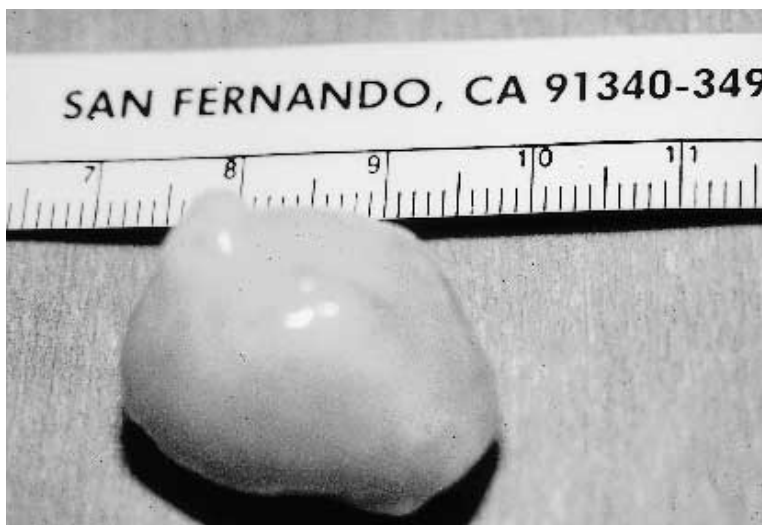
Figura 4. Schwannoma resecado.

sobre el mismo, los casos asintomáticos se deberían al crecimiento lento con elongación y adaptación del perineuro, coexistiendo fascículos intactos con otros empujados por el tumor que ejerce discreta compresión, manteniendo su integridad funcional.