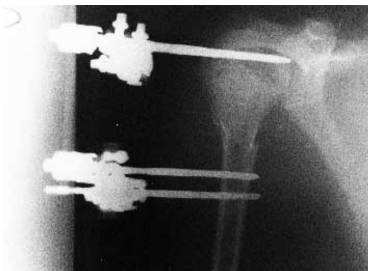
Figura 2A. Radiografía de fractura subcapital de húmero. Control inmediato.