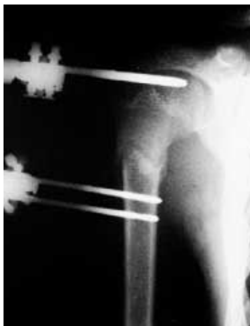
Figura 2B. Radiografía de esta fractura subcapital de húmero en la que se observa callo suficiente para retirar el fijador.

dad del dispositivo por parte del paciente y su satisfacción con los resultados.