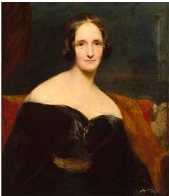
National Portrait Gallery, Londres

Richard Rothwell. Mary Wollstonecraft Shelley , 1840. Oli sobre taula, 61×73,7 cm. Alguns han considerat Frankenstein (1818) de Mary Shelley com un precursor de la ciència-ficció. En aquesta obra l'avenç científic relacionat amb la generació de vida és un monstre que es rebel·la contra el seu creador.