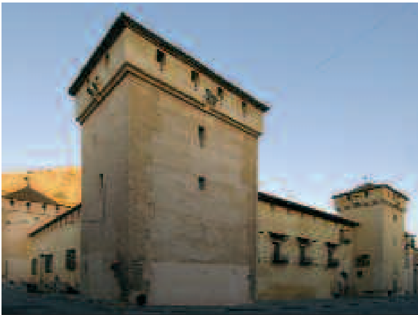
Palacio Condal de Cocentaina

Como sucede con los castillos señoriales, se sitúa junto a uno de los flancos del recinto amurallado, hacia el Regall y pudo adoptar una planta cuadrangular con torres en las esquinas y patio central 10 . Las familias acomodadas de la pequeña nobleza de cavallers , generosos y donzells , favorecida por la jurisdicción alfonsina desde 1329-1330, y la burguesía adinerada de los ciutadans , acostumbrada a acceder a los cargos públicos y a prosperar al servicio de la corona, se sumaron a la nobleza que había recibido señoríos desde la conquista para componer un patriciado urbano tocado por el afán de distinción en su comportamiento social en tiempos de notable movilidad social. El uso de la heráldica, de ciertos títulos y tratamientos y a la preferencia por formas de sociabilidad diferenciadas en la alimentación y la indumentaria