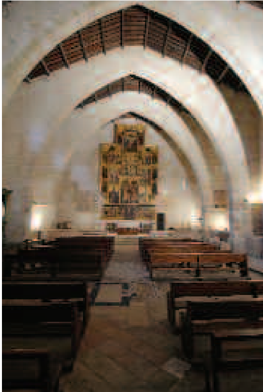
Interior de la Ermita de Sant Feliu, Xàtiva

Nicolás, que se situó en el Grau desde 1343; Ontinyent también contaba con dos parroquias en el siglo XIV dedicadas a la Virgen y a san Miguel. Todo ello nos habla de un empuje decisivo para la construcción de nuevas iglesias parroquiales hacia la mitad del trescientos, cuando la colonización se había asentado y la minoría mudéjar había quedado definitivamente sojuzgada. La mayoría de las parroquias amparadas en las fortificaciones se trasladaron al núcleo urbano y se contó con más medios para sustituir las viejas mezquitas consagradas como iglesias por edificios de nueva planta.