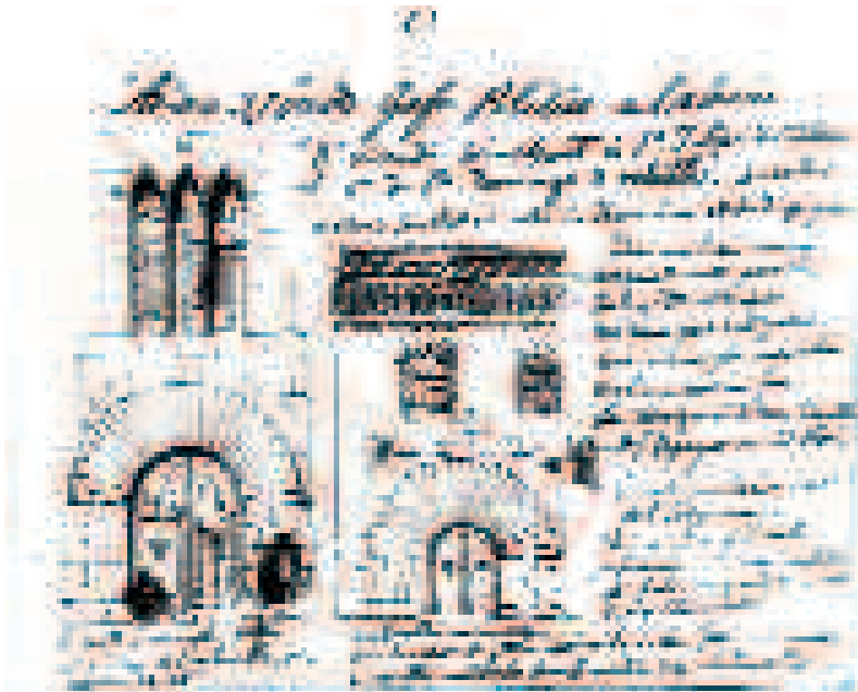
Edificios medievales de Xàtiva según dibujo del pintor francés Adrien Dauzais (1837)

vieran para nombrar las salas y estancias de los palacios y de las casas nobles: así en el palacio ducal de Gandia la cambrà vert recibía esta denominación por los azulejos verdes y azules sobre fondo blanco. La solución abovedada de algunas dependencias debe entenderse, pues, como síntoma de una voluntad de distinción como en las crucerías de la Sala dorada y de la capilla de San Antonio del palacio condal de Cocontaina. En 1404 el rey Martín I el Humano quedó prendado de una techumbre que había visto en el palacio de Guillem de Bellví en Xàtiva y quiso comprarla, pero el dueño de la casa se la regaló para que la instalase en una sala del palacio real mayor de Barcelona, conocida por ello como palauet de Bellví . En aquella visita el monarca pudo admirar otras dos techumbres en la casa de Pere de la Guerola y Tomàs de Vallebrera, que también le agradaron y adquirió para su traslado a Barcelona, donde se encargaron de montarlas Gon-