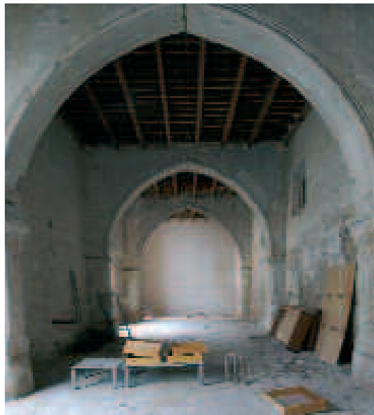
Interior del Palau de l'Ardiaca de Xàtiva