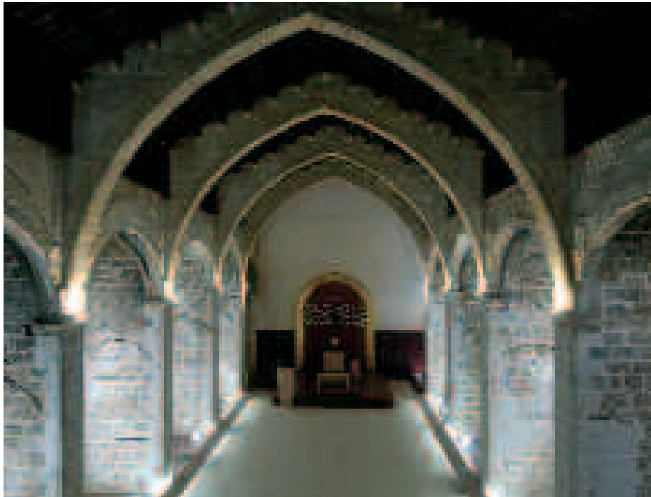
Interior de la iglesia de San Francesc de Xàtiva

en la ecclésia del dit monestir 39 . Este proceso constructivo, intuido más que documentado, ilustra con claridad las vicisitudes de este tipo de edificios, sujetos a impulsos inconstantes y a donaciones irregulares, pero también propicios a ampliaciones en función de los recursos y las necesidades de las comunidades de frailes. El refectorio reproducía el sistema constructivo de armadura de madera sobre arcos diafragmáticos de sobrios perfiles que rematan en ménsulas en forma de pirámide invertida. La sala capitular era un ambiente de planta cuadrada, con muros de tapial, cadenas de sillares en los ángulos y los contrafuertes y bóveda de crucería de piedra apeada en ménsulas empotradas en el