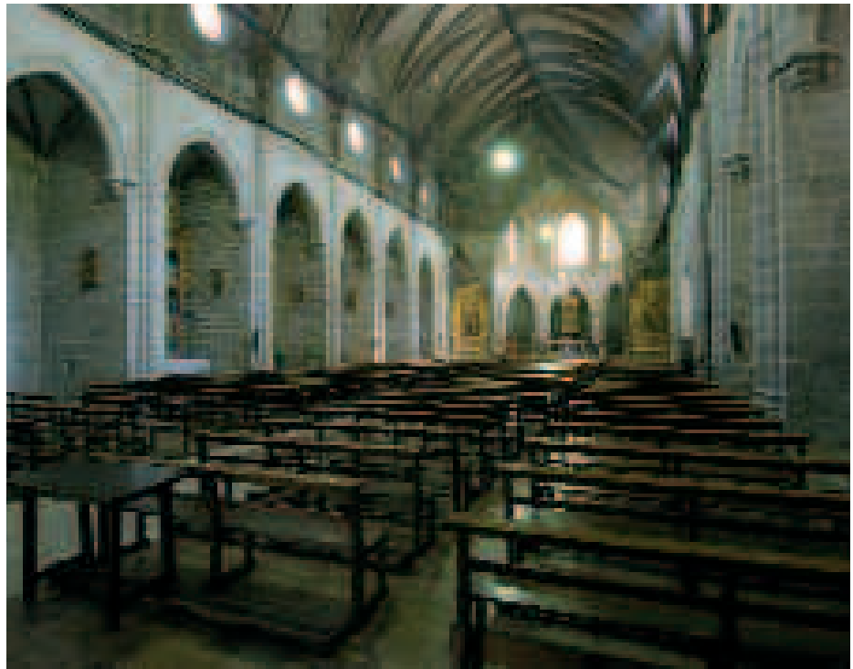
Interior de la Colegiata de Santa María de Gandia

Sin embargo, a partir de la segunda mitad del siglo XIV surgen algunos proyectos de cierta ambición tanto en lo constructivo como en lo ornamental que entroncan ya con las experiencias del tardogótico en otros centros de la Corona de Aragón.