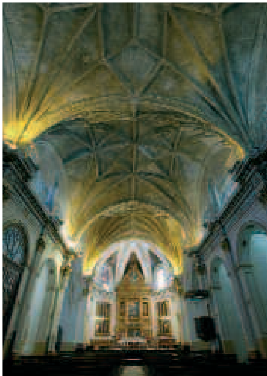
Interior de la iglesia de Santa María de Ontinyent