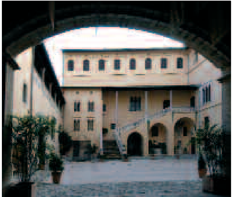
Patio de armas del Palacio ducal de Gandia