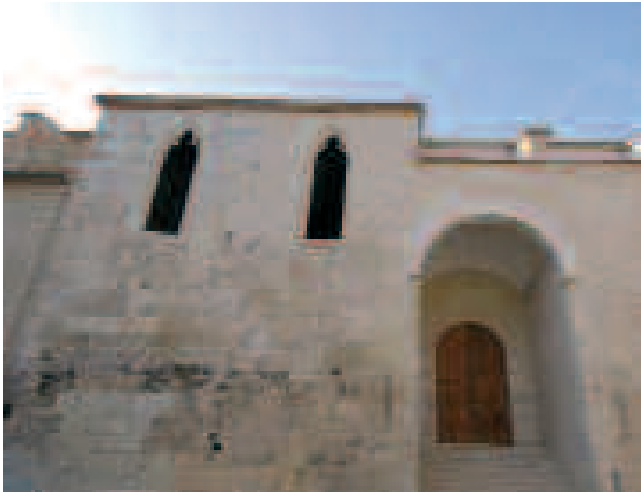
Convento de Santo Domingo de Xàtiva

do aún por la impronta islámica 32 . Si bien tales motivaciones podían ser bien entendidas en las tierras del sur, los centros rara vez podían mantener más de dos de estas fundaciones, que luego se incrementarían en los siglos XV y XVI.