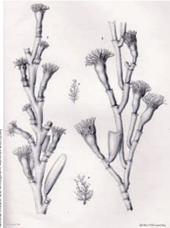
National Oceanic and Atmospheric Administration (EUA)