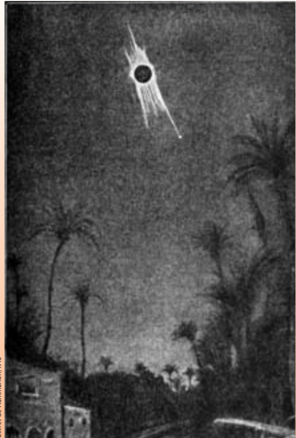
Extret de Flammarion, 1910

Però dos elements nous van reforçar l'interès dels eclipsis en aquells anys. El primer va ser la fotografia. L'any 1842 s'havia obtingut el primer daguerreotip d'un eclipsi. A partir d'aquell moment ja es podien «congelar» aquells segons fantàstics per a estudis posteriors. El segon va ser l'espectroscòpia. Ja l'any 1840 es van