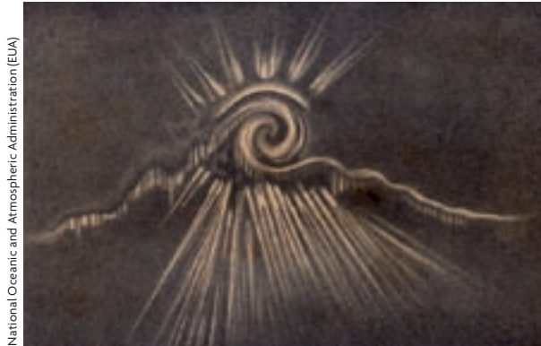
National Oceanic and Atmospheric Administration (EUA)