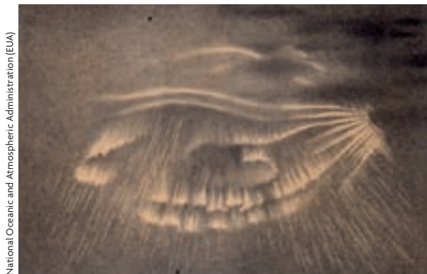
National Oceanic and Atmospheric Administration (EUA)