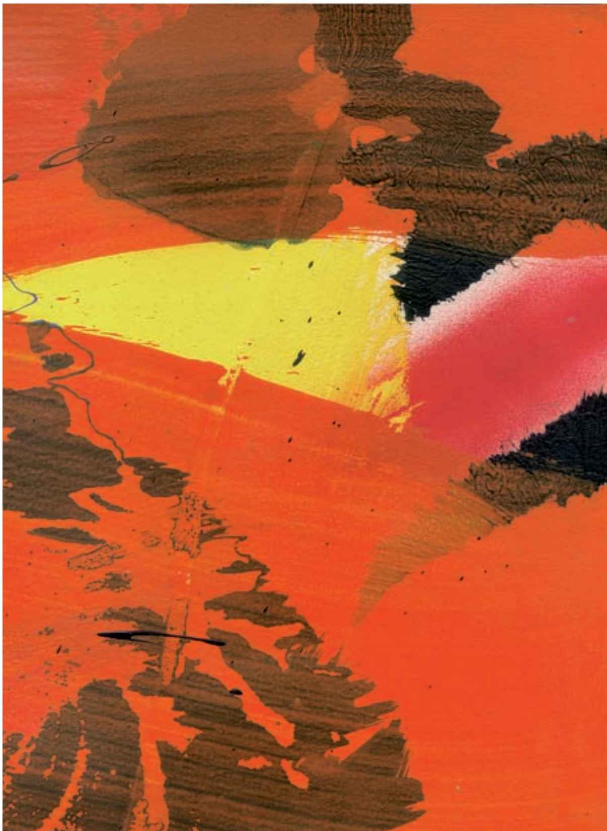
Juan Olivares. Viaatge al centre de la Terra VI , 2013. Acrílic sobre paper, 21,5 x 28,5 cm.