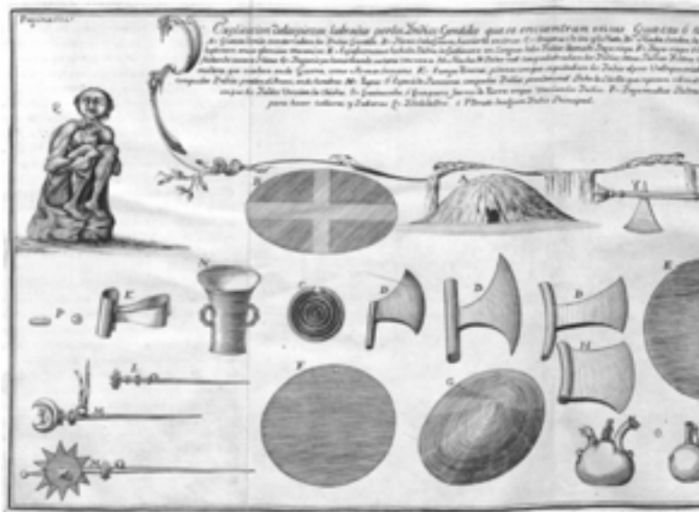
Làmina extreta de JUAN, J. I. A. ULLOA, 1748

Observació dels diferents contactes del trànsit de Venus realitzada per James Cook i publicada a Philosophical Transactions . S'hi observa l'anomenat efecte de gota negra, que fa molt difícil determinar el temps exacte del contacte i que ara sabem que és, principalment, degut a una manca de qualitat de les òptiques utilitzades.