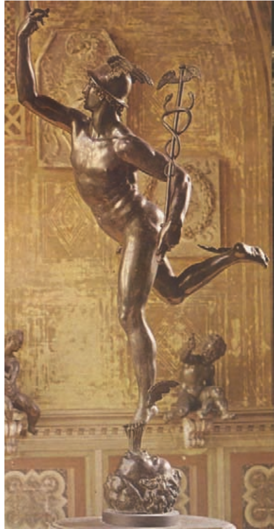
Fig. 5.- Giambologna. Mercurio volante . Museo Nacional del Bargello.