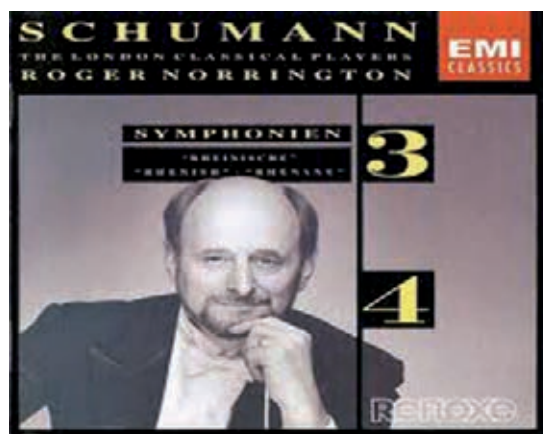
Fig. 2.- Edición de EMI de la Tercera Sinfonía de R. Schumann

Tal vez el aspecto poético de la obra de Schumann, muy especialmente en la Tercera Sinfonía a la que hemos aludido, se encuentre en la vertiente romántica que tan bien lo define. Un romanticismo, muchas veces exasperado, que inunda no sólo su ser, enfermizo y frágil, sino también su inteligencia desbocada. Una poeticidad vinculada, generalmente, con su frecuente incursión en el mundo de la poesía, y que se enhebra con frecuencia en el ámbito poético 10 .