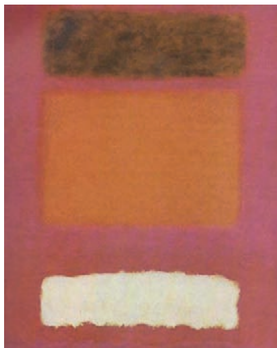
Fig. 3.- Mark Rothko. Roja, blanco y marrón , 1977