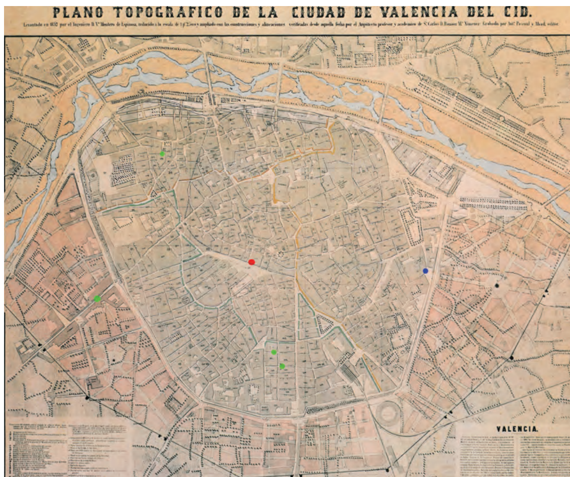
Fig. 2.- Distribución de los inmuebles legados por Estanislao Sacristán y Mateu a sus hijos en 1854. En rojo, ubicación de la droguería de la Luna en plena plaza del Mercado. En azul, domicilio principal donde vivirá Estanislao Sacristán y Ferrer y donde guardará su colección. En verde, otras propiedades.