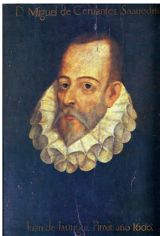
Fig. 4.- Supuesto retrato de Miguel de Cervantes, atribuido a Juan de Jáuregui. Real Academia Española.

ellas es la edición del Quijote cuyas líneas maestras dejó transcritas en su cuaderno de notas. Dado su carácter minucioso, sabemos incluso la fecha en que concibió ese proyecto y el lugar: 12 de abril de 1880 a las 12 de la mañana estando en la calle de las Nieves junto a la reja que da a la calle del Santísimo. De la detallada descripción podemos destacar varias cosas. Su amor por Valencia que le lleva a incluir tanto el escudo de la ciudad de Valencia como el sello o escudo de la