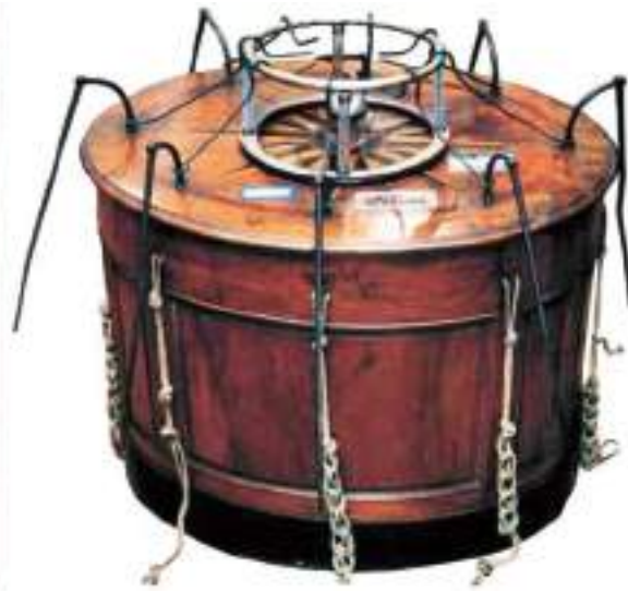
Fig. 3.- Grabado s. XVIII. Sesión con La baquet magnetique en Musée d'Histoire de la Médecine et de la Pharmacie, Lyon, Francia.

¿Conseguía sus objetivos? Por lo que parece así era a corto plazo. Evidentemente en las sesiones de Mesmer el Carpe Diem era lo principal, pues una vez abandonadas, si no eran constantes, las dolencias volvían a hacer acto de presencia. Esa evasión de la realidad era lo que llamaba la atención a las encopetadas damas de la corte, que ansiosas de nuevas experiencias, y sin enfermedad o patología alguna, acudían a Mesmer en busca de fuertes emociones que les hiciera buscar alternativas a la tediosa vida palaciega.