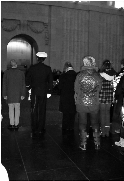
• Ceremonia conmemorativa diaria en el memorial de la ciudad de Ypres por los aliados caídos durante las batallas del saliente de Ypres en la Gran Guerra.

Freud como un proceso de duelo que transforma su narcisismo fragmentado en la formalización del comportamiento simbólico. Ahora bien, este trabajo tiene una casuística peculiar: se produce a través de un objeto simbólico transicional que sustituye a la madre, un objeto que tiene la capacidad de llevar a cabo una representación del elemento ausente.