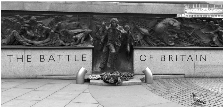
• Memorial de la Batalla de Inglaterra en Embankment, Londres.

Ahora bien, el mismo Saul Friedländer defiende, unas páginas más adelante, que esta relación transferencial con el fenómeno traumático se traduce en dos tendencias que juegan necesariamente un rol en el trabajo del historiador del Holocausto. 26 Por un lado, la tentativa de establecer una distancia con el objeto de estudio derivada de la pretensión de objetividad en el resultado de la investigación. Por otro lado, el impacto emocional y su perturbación ante el drama humano que tiene que narrar.