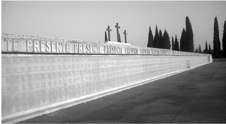
• Il sacrario militare di Redipuglia in Friuli, Venezia-Giulia, ricostruito in la época fascista en memoria de 100.000 soldados muertos en la Gran Guerra.